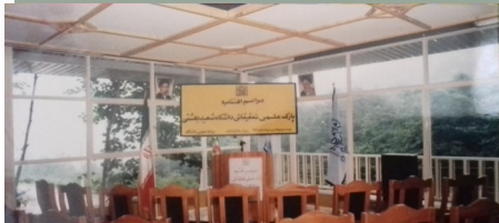
مراسم افتتاحیه پردیس علمی تحقیقاتی زیرباف دانشگاه شهید بهشتی، خرداد ۱۳۸۱